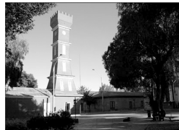
Чили. Город Викинья

Габриэла Мистраль была настоящей дочерью своего народа — она родилась в 1889 году в небольшом чилийском городке Викинья в бедной семье крестьянки и шахтера. Через все ее творчество проходит красной нитью любовь к простому чилийскому народу, его быту, жизни и мечтам. В своих стихах она передает живой народный язык чилийской провинции. Первой и самой любимой книгой, к которой она обращалась в течение всей жизни, стала Библия. На протяжении долгих лет Габриэла сохраняет в своем сердце и своем творчестве доверительную, детскую веру в Бога.