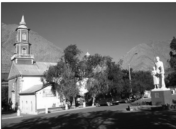
Церковь, в которую ходила Габриэла

Мистраль в своих стихах поклоняется Богу, с твердой верой и простотой черпает у Него свою надежду. Даже материалист Пабло Неруда, еще один чилийский поэт, лауреат Нобелевской премии, отмечает, что вся жизнь поэтессы являла собой образ смиренности искренней христианки. В своих воспоминаниях «Признаюсь: я жил» он пишет о том, что Габриэла походила скорее на строгую монахиню, чем на светскую даму.